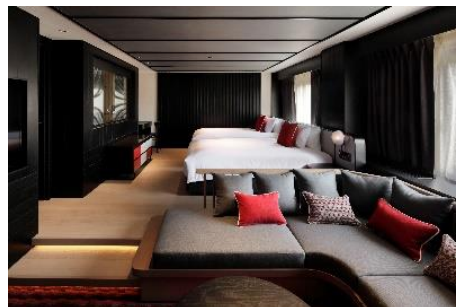
クロススイートジュニア

宮城大弥投手、山本由伸投手、吉田正尚選手の直筆サインボールや、京セラドーム大阪の指定席、Buffaloes 応援タオルなどがついた「ガッチリMAX！」な特別宿泊プランをご用意します。