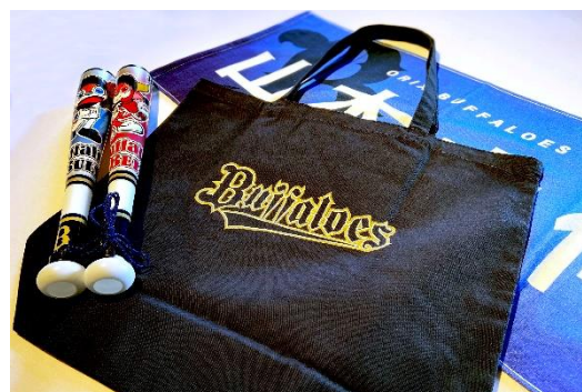
Buffaloes 応援グッズ イメージ

本企画は、2021年9月18日（土）～10月21日（木）の期間、京セラドーム大阪で開催されるオリックス・バファローズ主催19試合の開催日限定の宿泊プランです。各日1組2名さま限定で、宮城大弥投手、山本由伸投手、吉田正尚選手のうち日替わりで1名の直筆サインボール、Buffaloes 応援タオル、Buffaloes ネーム&ナンバートートバッグ、Buffaloes マスコットツインバットの応援グッズ、さらに京セラドーム大阪のバックネット裏中央エリアのビュー指定席観戦チケットがついています。試合観戦後は、当ホテルの最上階にある広々とした48㎡のスイートルーム「クロススイートジュニア」で、ワンランク上のホテルステイを満喫いただけます。