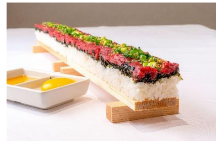
「特製ユッケ寿司50cm」 3,300円

※7月20日（火）に、店舗にてメディア内覧・ご試食会を開催いたします。詳しくはプレスリリース2ページ目をご覧ください。