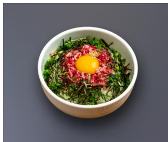
「至福の一撃 牛トロ飯」 870円