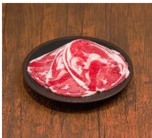
北海道名物「ジンギスカン」 760円

メニューは定番の焼肉メニューのほか、「ジンギスカン」（760円）「至福の一撃 牛トロ飯」（870円）などの北海道名物、関西ではなじみのないものの、北海道では伝統的に食べられている豚ホルモン5種など、神戸にいなながら北海道を感じていただけるメニューを揃えました。元パティシエの店長が作る、季節のフルーツを使った「本日のメパフェ」（時価）もご用意しております。また、50cmの「特製ユッケ寿司」（3,300円）、22cm×23.3cmの特大サイズのグラスに4個分のレモンを入れたレモンサワー「ゆうじろうレモン」（レモンサワー飲み放題に+980円）など、映えメニューも充実しています。