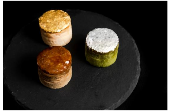
3色のチーズケーキを楽しめる「メダルチーズケーキセット」

「4年に1度の世界的スポーツの祭典に向けて気持ちを高めてもらおう」と、自社ブランド「Zipangu（ジパング）」の看板メニューである「キャラメリゼチーズケーキ」を円形にした特別バージョンで、3つのメダルの色にちなんだ「金チーズケーキ」「銀チーズケーキ」「銅チーズケーキ」を考案。3つセットで「メダルチーズケーキセット」として販売します。「金チーズケーキ」は、オリジナルキャラメリゼチーズケーキに金箔を、「銀チーズケーキ」は、抹茶キャラメリゼチーズケーキに銀箔を、「銅チーズケーキ」には、ほうじ茶キャラメリゼチーズケーキにキャラメルコーティングを施しました。