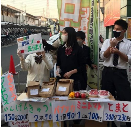
商店街でのマルシェの様子

パナソニック株式会社（以下、パナソニック）のショールーム「パナソニックセンター大阪」（大阪市北区）は7月18日、『ウメキキマルシェ×四條畷学園高校「STAR」』を開催します。四條畷学園高校の生徒らが、規格外商品を抱える農家から野菜を預かり販売するイベントです。