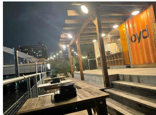
コロナ禍で外食を控える理由(最大3つまで選択)

コロナ禍で政府によって新しい生活様式が推進され、人々は三密を避けた行動が求められています。リクルートライフスタイルが行った調査では、外食をしない理由として「感染しないか不安だから」という回答が最多でした。『周囲がどう思っているか』という意識よりも、『コロナから自分を守る』という自衛意識が高まっていると言えます。さらに、同調査ではコロナ禍での外食において店選びで重要視する点として、49.8%が「きちんと換気がされているか」と回答しています。