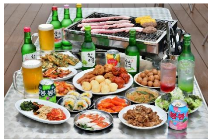
ビュッフェ イメージ

【内容】プレミアム肉セット(和牛ロース、国産豚バラ、牛タン、国産ホルモン、国産熟成肉)/焼き野菜/包み野菜