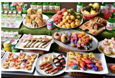
スイーツビュッフェ イメージ