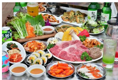
韓国BBQ 和牛肉セット