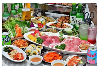
プレミアム肉盛BBQセット