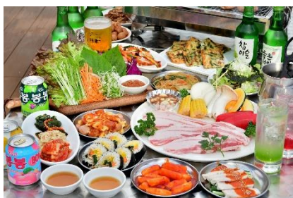
国産豚肉使用 サムギョブサルセット