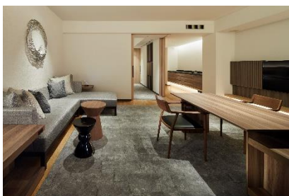
(テラス・スイート)