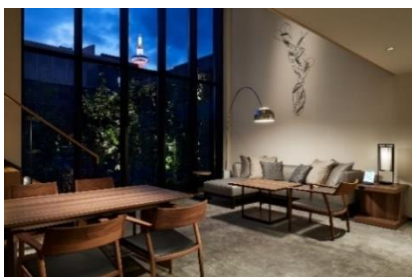
(ザ・サウザンド・スイート)