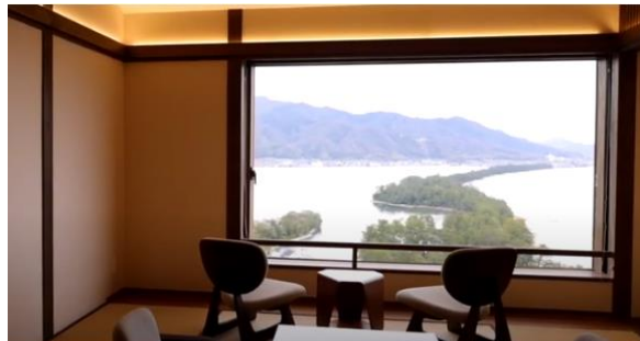
「ラグジュアリー」編（3分44秒）