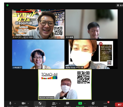
コンセントカフェ@zoom店の様子