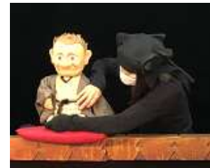
実際の人形を使ったリハーサルの模様