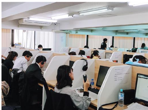
感染拡大前の弊社コールセンターの様子