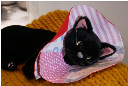
エリザベスカラー作りのワークショップ