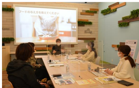
門馬更夢氏によるネコモアミーティング