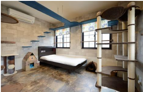
猫リフォーム事例