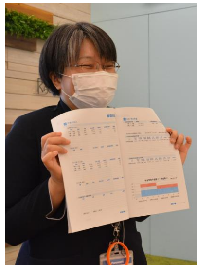
ファイナンシャルプランナーによる猫とくらすためのライフプラン作成