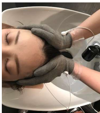
発毛を促すヘッドスパ