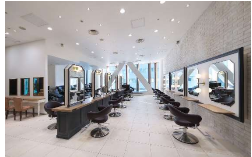
白を基調とした店内

店舗名 : GRANMASH(グランマッシュ)梅田店 住所 : 大阪市北区梅田2-2-2ヒルトンプラザウエスト4階 TEL : 06-6345-5708 営業時間 : 11時~20時(カット最終受付19時) 店舗面積 : 55坪 席数 : セット面20台 定休日 : 年中無休