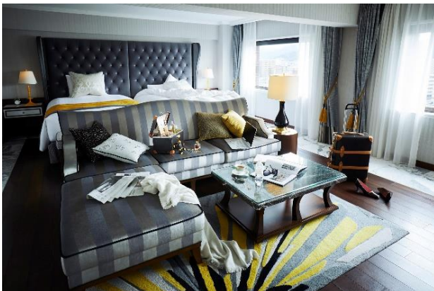
「モダンスイート」 73,700 円～

「Nostalgic Journey（ノスタルジック ジャーニー）」をイメージワードに、客室全 218 室のうち 23 室を特別フロアとし、「スイートルーム」「京プレミアム」「プレミアエグゼクティブダブル」（合計 23 室）を新設します。