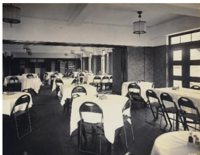
京都ステーションホテル時代の内観