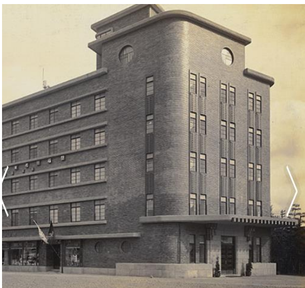
歴史と伝統を紡ぐホテル

1928年に前身である「京都ステーションホテル」が天皇即位の礼（御大典）の慶祝事業の一つとして開業し、約90年。培ってきた"おもてなし"を受け継ぎながら、時代のニーズに沿ったサービスでお客様をお迎えいたします。