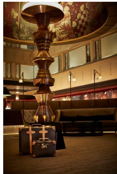
ヒストリーブックの表紙

1928(昭和 3)年 3 月、昭和のご大典(昭和天皇の即位式)の慶祝事業として、京都商工会議所などが整備した京都ステーションホテル(現在の京都センチュリーホテル)が開業しました。敗戦により 1945(昭和 20)年 10 月から米軍宿舎と