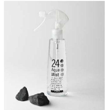
「24 アクアミスト」とブラックシリカ原石