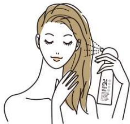
①カラー剤塗布前にスプレー