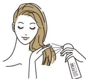
②放置後、シャンプー前にスプレー