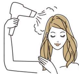
③乾かすと自然なツヤが生まれます