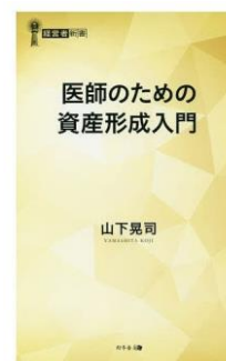
代表 山下晃司著 『医師のための資産形成入門』