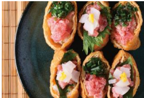
とろたくいなり 1,280円