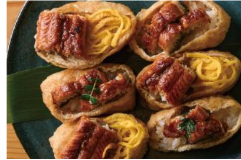
うなぎのいなり 1,570円