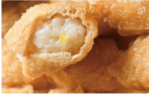
一口いなり 10貫 = 1,000円 14貫 = 1,200円