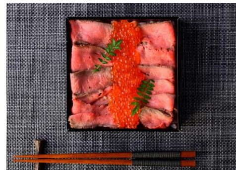
むろやの肉ちらし 2,500円