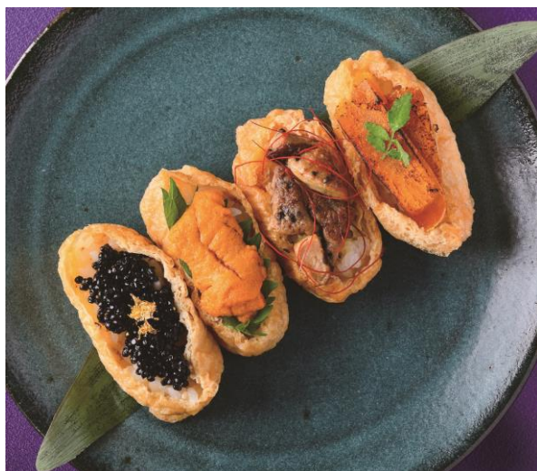
「日本一高いいなり」（3,800円）