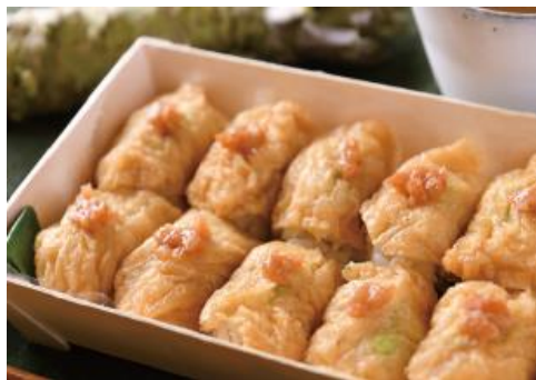
わさびと梅のいなり 1,200円