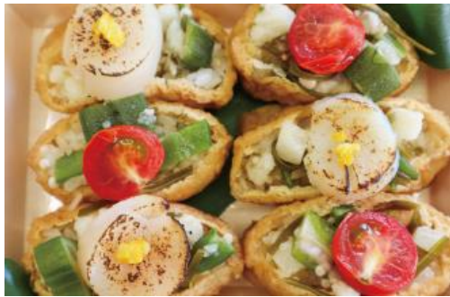
炙りほたてのいなり 1,300円