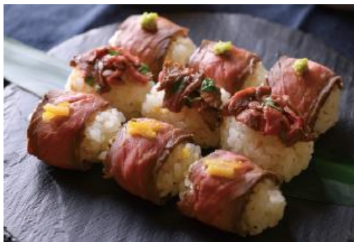
柚子香る肉寿司 1,500円