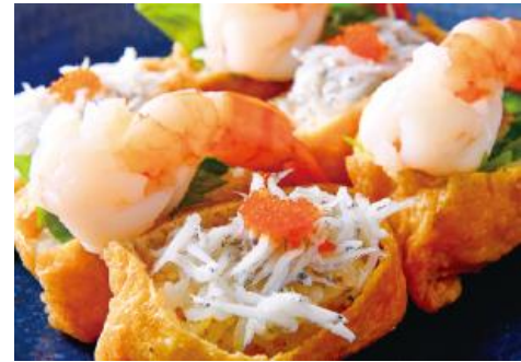
海老としらすのいなり 1,500円