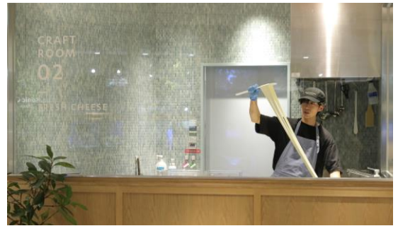
チーズは毎日、店内工房で手づくり