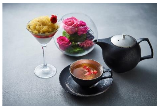
ローズパフェとフラワーティー 1,500円（税別）