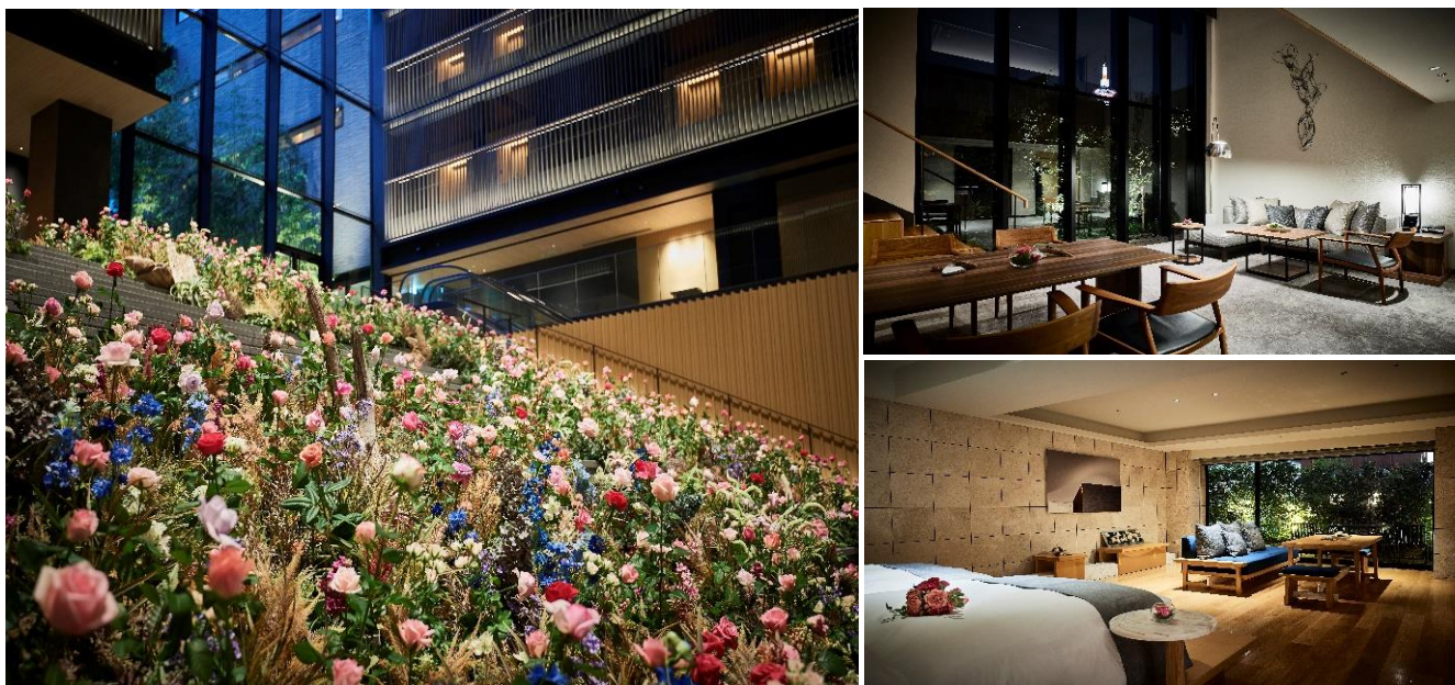
シンボルの大階段を花とグリーンで装飾。バラ摘み体験も。スイートルームはバラとグリーンのコンセプトルームに。

坪庭を設えたエントランスから始まる花と緑のストーリー、シンボリックである寺社仏閣をインスパイアした大階段をGardenに見立てた装飾だけでなく、レストラン装飾、客室(スイートルーム)にもバラやグリーンを取り入れ、ザ・サウザンド キョウトを五感でお楽しみいただける期間となっています。