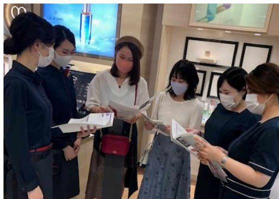
対面での最終打ち合わせの様子(10月3日)

今年で73回を迎える歴史ある大学祭「京都女子大学 藤花祭」。今年はこのコロナ禍により、初めての試みとしてオンライン大学祭を開催することとなりました。従来3日間行われていましたが、初のオンライン大学祭ということで今回は11月1日から3日間(※3月31日までの5か月間動画コンテンツを視聴可)実施します。