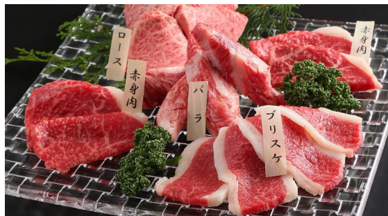
お好きなメニューを選べる5,500円プラン