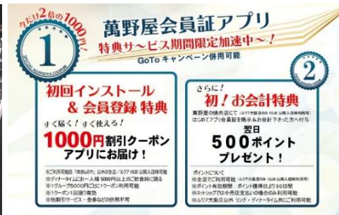
公式アプリダウンロードで1,000円分ポイント