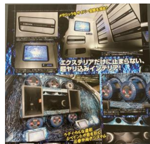
カスタムカー製作の技術を 生かしています