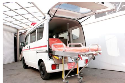
救急搬送車。主に病院間の患者の搬送に使用します。ストレッチャーや酸素ボンベなども装備しています（左） ストレッチャーの代わりに車いすを搭載することもできます（中）。軽自動車の救急搬送車も販売しています（右）