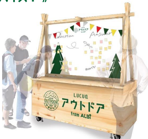
↑フロアに設置されるQAボード

公式インスタでは、みなさんのアウトドアライフも発信！ぜひ、#ルクアアウトドア を付けて投稿してくださいね！あなたのアウトドアライフをリポストで紹介させてください。