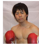
プロボクサー 徳山洋輝選手

医療機関にて栄養指導を行う。百貨店・食品メーカー講師、レシピ提案など、乳幼児から高齢者までを対象に幅広い年齢層に対し、食と健康に関する講演会や料理講習会を行う。