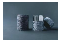
糸巻きお茶缶 4,400 円/個