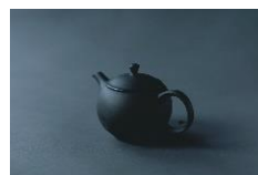
常滑焼急須 6,600 円

客室には、シックでモダンな常滑焼の急須や有田焼の湯呑み、京都の伝統工芸品「京くみひも」をあしらった、職人が1つ1つ手作業で作製した茶缶や、肌触りが優しく丈夫なバニラン素材を使用したオリジナル作務衣をご用意しております。是非お試しください、お土産や贈り物としてもご利用ください。