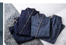
作務衣 8,800 円