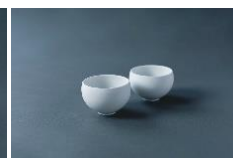
有田焼湯呑み 1,650 円/個