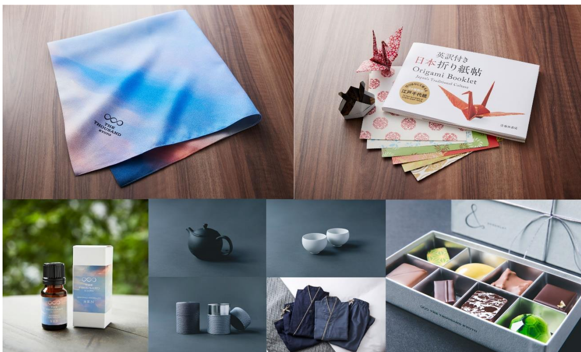
(左上より) THE THOUSAND KYOTO オリジナル風呂敷、折り紙帖 アロマオイル、茶器・作務衣、チョコレートBOX

京阪グループのフラッグシップホテル「THE THOUSAND KYOTO（ザ・サウザンド キョウト）」は、ホテルオリジナルグッズをフロントにて販売しております。8月20日から新たに、ホテルオリジナル風呂敷と折り紙帖が加わりました。是非、記念品やお土産に是非お買い求めください。※料金には全て消費税が含まれております。