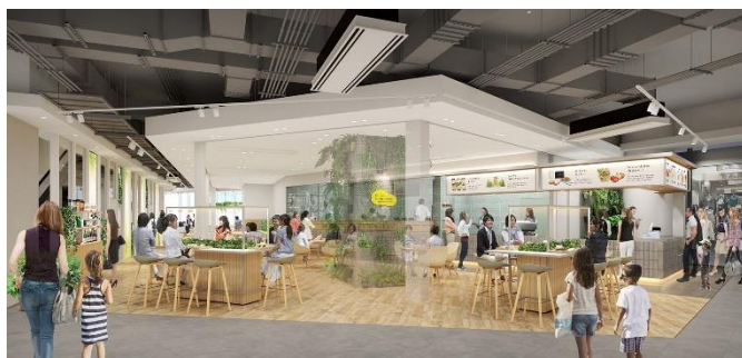
Re-Life ON THE TABLE

「食」を通じて新しいくらしのヒントを発見できるカフェ。店内のチーズ工房で作る出来立てのフレッシュチーズとホットサンドを提供します。また、「食材へのこだわり」や「手づくりの楽しさ」などをテーマに、生産者やシェフによる実演・セミナーを開催、レシピ動画の配信を実施。あわせて地産地消の食材選びやプラスチックごみ低減に貢献する食器「セルローズファイバーカップ（※注）」を販売するなど、環境にも優しい食のライフスタイルの提案・発信を行います。