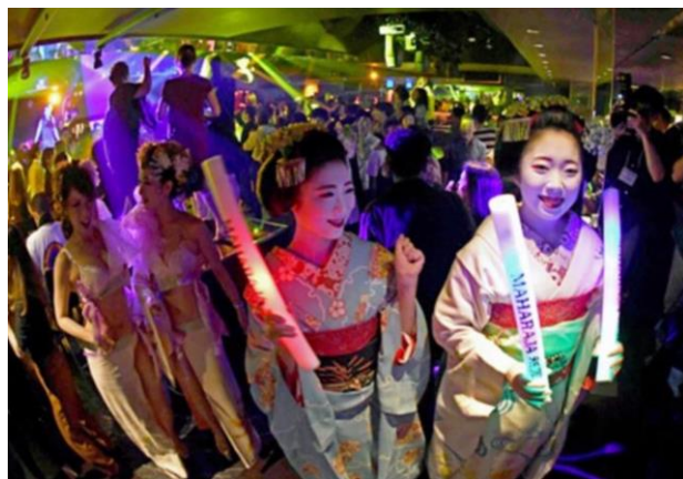
京都らしい演出でインバウンド層にも人気