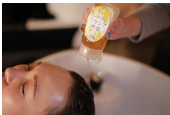
ハンドケア・ヘッドスパを無料でサービス