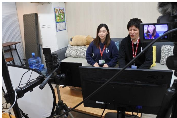
2月26日(水)に開催した会社説明会配信の様子