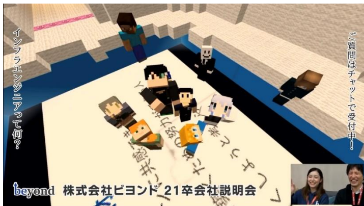
2月26日(水)に開催した会社説明会オンラインゲーム画面の様子

株式会社ビヨンド（大阪市浪速区／横浜市中区）は、2021年度入社の新卒採用活動において2月26日(水)、オンラインゲームを活用した会社説明会を実施いたしました。一風変わった採用活動方法で就活生の心を掴むとともに、優秀な地方学生の獲得や、会社内容の理解を深める狙いです。