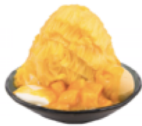
マンゴーかき氷 1,570円