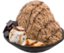
コーヒーかき氷 1,240円