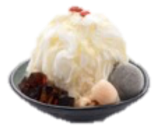
【日本限定】杏仁かき氷 1,240円