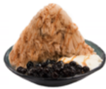
タピオカミルクティーかき氷 1,130円