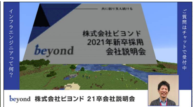
会社説明会 YouTube Live配信イメージ