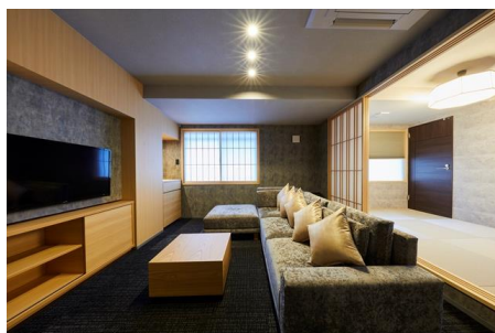
内観 (ホテルタイプ)