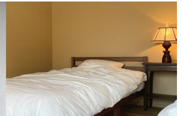
住んでみたくなる宿 森の宿

2020年2月1日～3月11日、淡路島を体感できる宿泊施設「森の宿」のみプレオープン。 ご予約はこちら TEL: 0799-70-4583