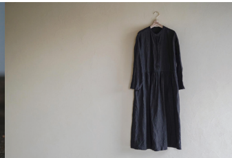
古道具・雑貨・手みやげ・衣服 山の上の雑貨店