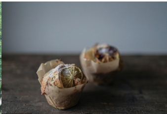
おやつのできあがり こぞらのおやつ