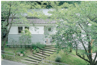
喫茶とランチ 森のオト

遠方からわざわざ足を運んで頂くお客様にも、お近くの地元のお客様からも、末永く愛される「笑顔が溢れる温かい場所」を築き上げていきたいと思っております。全体のオープンは2020年3月中頃予定です。どうぞ宜しくお願いいたします。