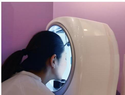
皮膚の状態を解析