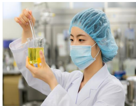
札幌の自社工場で一から作ります