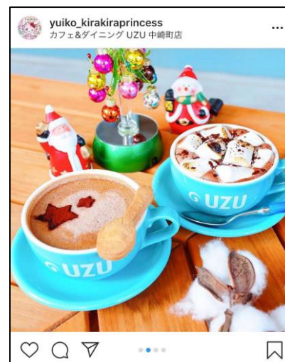
左、⑥ふわふわまるっきーの (430円) 右、⑦スモアライクホットチョコレート (550円)