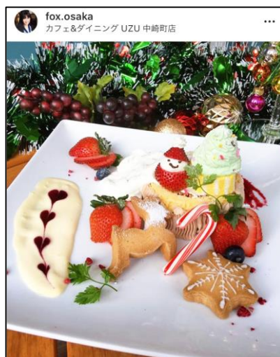
④雪ふるXmasプレート (1,200円)