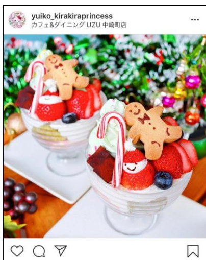
⑤ギュギュツとXmasパフェ (1,000円)