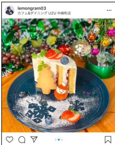
①クリスマスショートロール (650円)