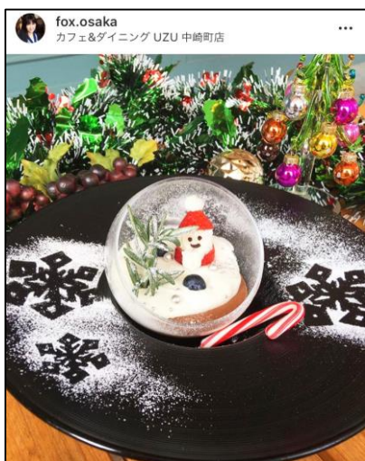
③チョコムースのスノードーム仕立て (650円)