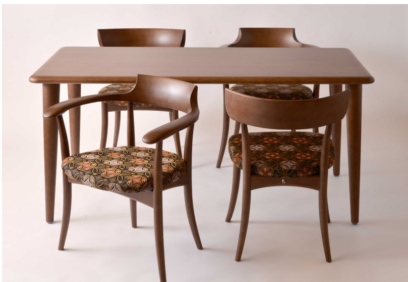
テーブルセット ¥540,000(税込)

椅子は座り心地の良さを追求し、テーブルは使い心地の良い物、そして眺めて楽しめる家具・インテリアなど、「居心地のいい空間」を企画・生産するのが当社のコンセプトです。