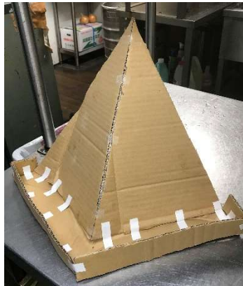
段ボールの試作品