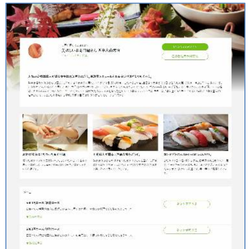
エジソンの予約画面（寿司屋の例）

株式会社ビヨンド（ https://beyondjapan.com/ ）は、2007年4月に設立した、サーバーの構築・運用管理、Webシステム開発、Webサービスを手がける会社です。24時間365日のサーバー監視サービスで培った運営ノウハウがウリです。