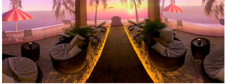
※こちらはイメージ写真です

風呂上がりや就寝前のひとときを、心地よいマッサージ、リゾート映像と癒しのBGMと共に、リラクゼーションタイムをお楽しみくださいませ。