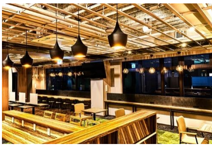
天空の錦ラウンジ（男の隠れ家）