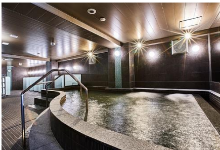
和みの人工温泉 錦の湯 男性大浴場