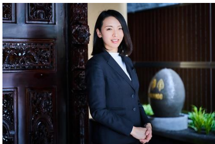
女性支配人が就任