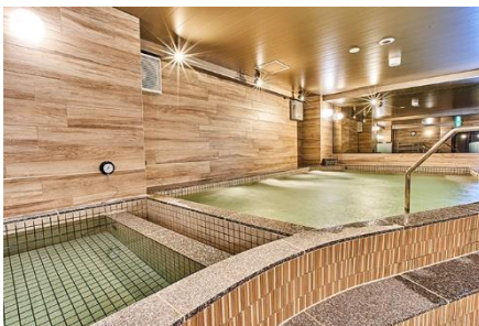
和みの人工温泉 錦の湯 女性大浴場