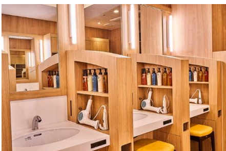
女性専用パウダールーム（化粧室）