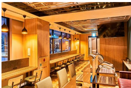
天空の錦ラウンジ（女の隠れ家）