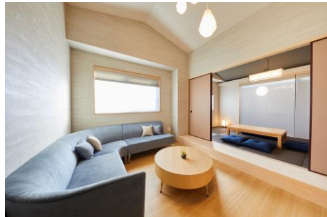
リビングルーム (7階)