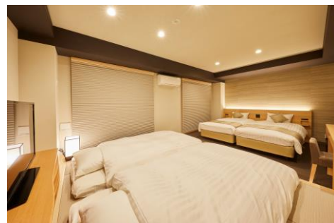
ファミリールーム