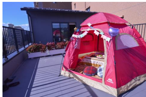
プレミアムルーム (7階) のベランダ