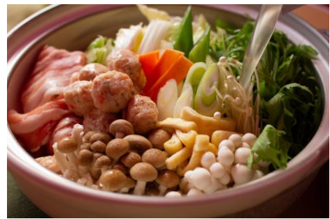
鍋は季節によって変わります