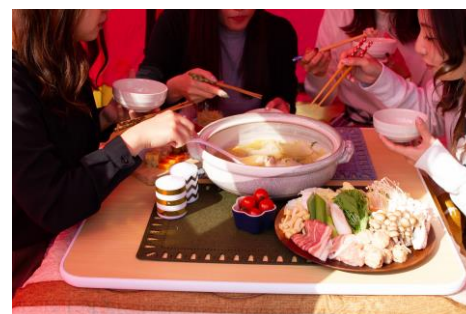
鍋セットをお召し上がりいただけます