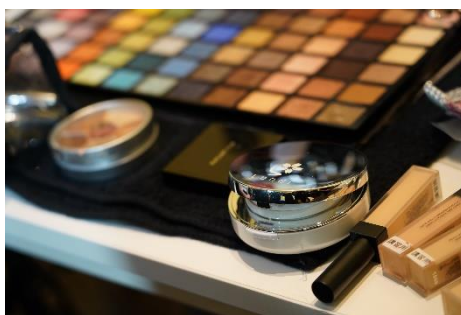
当日のバックヤードの様子