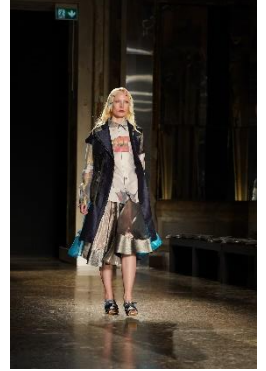
当日のランウェイの様子