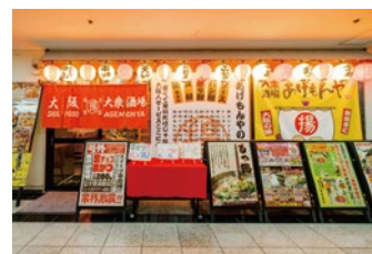
大衆酒場あげもんや 船場センター4号館店

■働く皆様を応援!日頃の感謝を込めて大盤振る舞いいたします♪「大赤字10円キャンペーン」実施!!