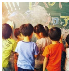
週末はお子様でいっぱい