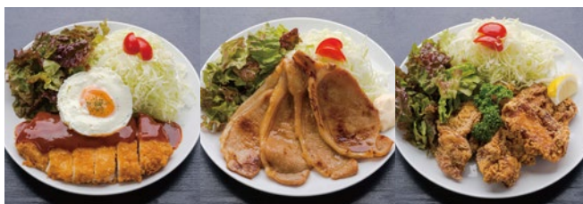
日替わりランチ10円