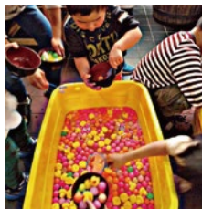
スーパーボールすくい