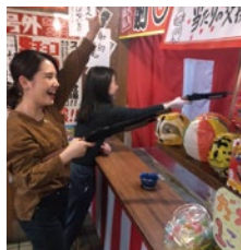
射的コーナーで落とした景品はお持ち帰りいただけます

住所 : 大阪市中央区船場2丁目船場センター4号館B2階209号室 店舗面積 : 28坪 TEL : 06-6484-8282 定休日 : 日曜日 営業時間 : 11時～23時 客単価 : 2,300円 席数 : 80席 メニュー数 : 串カツ53品/天ぷら30品/一品揚げ物