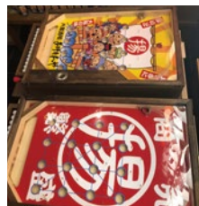
あげもんやオリジナル スマートボール

ぜひ貴社媒体でお取り上げをお願い申し上げます。ご不明点等御座いましたら、お気軽にお問い合わせ下さいませ。