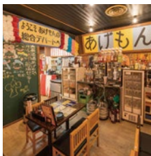
内装はスタッフ全員で 手作りいたしました