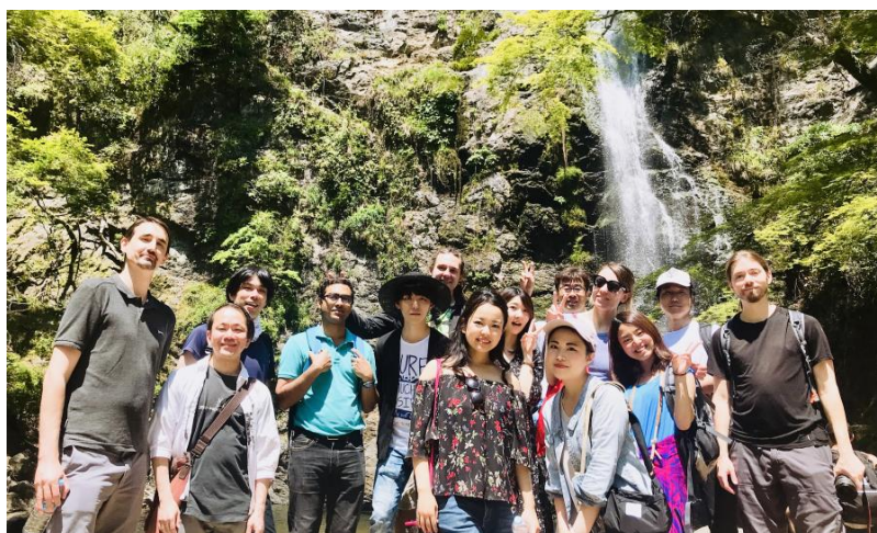
関西ハウス合同 箕面の滝ツアーの様子

関西エリア独自イベントとしてはこれまでに万博記念公園でのホテル鑑賞ツアー、箕面の滝ツアーなど地域特性を活かしたツアーイベントを行ってきました。そして、お花見会、ハロウィンパーティー、クリスマスパーティーなど季節のイベントを弊社企画で行うことに加え、入居者同士で自発的に自国や出身地の料理を振る舞うパーティーは日常的に行われています。