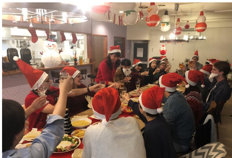
ソーシャルレジデンス調布 クリスマスパーティーの様子