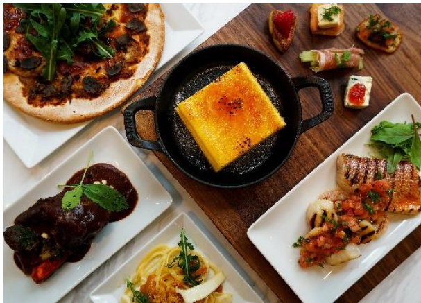
プリフィックスディナー（大阪チェンジ！前） →

（例：「イカとウニのカラスミパスタ」→「銘柄豚の焼きそば」／「牛ほほ肉の煮込み」→「牛ほほ肉のどて焼き」／「ニューヨークチーズケーキ」→「ヒョウ柄チーズケーキ」など）