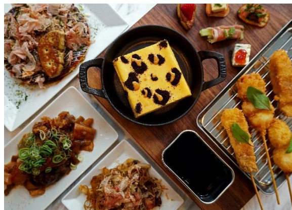
プリフィックスディナーを「大阪チェンジ！」

サンフロンティアホテルマネジメント株式会社とマリオット・インターナショナルが共同運営する「コートヤード・バイ・マリオット大阪本町」では、2019年10月1日（火）のホテル開業と同時にホテル業界で初となる「大阪チェンジ！」サービスを導入します。