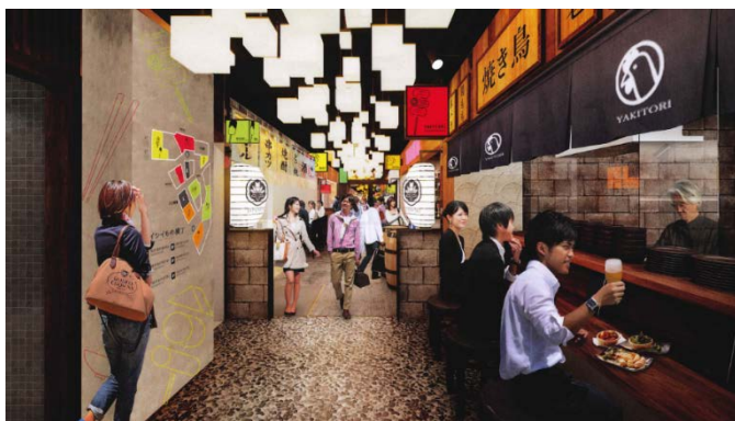
完成イメージパース(B1F 横丁館内)

B1Fには、粋な飲み屋を集めた横丁と、うめきたエリア最大級のスーパーマーケットがオープン。梅田の新名所・食のエンターテインメント空間を提供することで、多様な食があらゆる梅田人の胃袋を満たす、梅田最大級の食のメッカとなります。