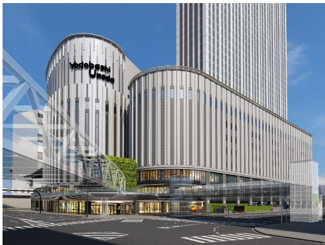
完成イメージパース (計画地北東側から)