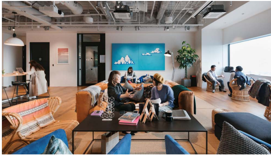
イメージ図 (WeWork なんばスカイオ)

8Fには、世界でコミュニティ型ワークスペースを運営するWeWorkがオープン。ベンチャー企業から大企業まで多種多様な業種の方々がメンバーとして参加しており、WeWorkのグローバルコミュニティを通じて、お互いに刺激し合えるコラボレーション環境を提供しています。柔軟性があり働きやすい空間、充実したアメニティとサービス、より快適な利用を促すテクノロジー、そして、ビジネスからライフスタイルまでの多様なイベントなどを開催することができる場を提供することで、新しい働き方や出会い、ビジネスの創出をサポートします。今回、商業施設と同じフロアにWeWorkをオープンするのは初めてとなりますが、訪れる人々のさらなるダイバーシティによる交流から、新しいアイデアやコラボレーションが生まれることを期待しています。