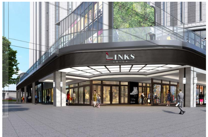
完成イメージパース (北東エントランス)