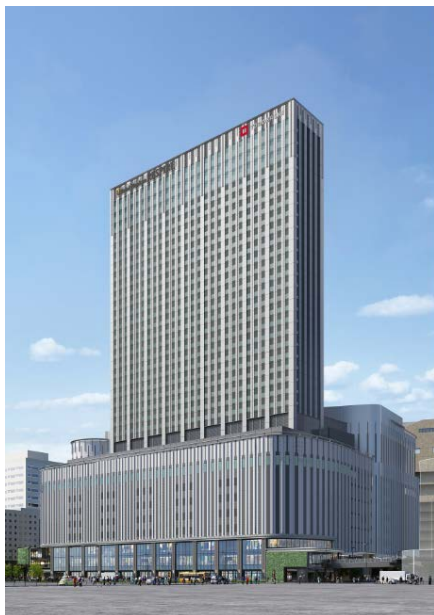
完成イメージパース (計画地北側から)