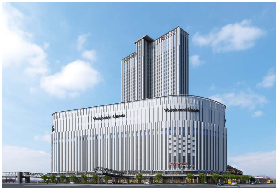
完成イメージパース (計画地南側から)