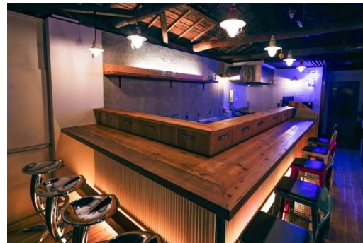
今後は日替わりBARも考案中