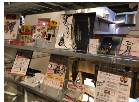
クリエイターの活動を応援するブースも