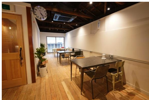
全席にコンセントを配備