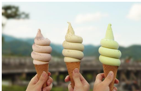
「ティーソフトクリーム」各480円