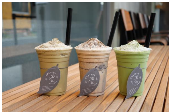
「スノーシェイク」(ウバ/抹茶/ほうじ茶 各680円)