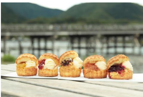
「スコーンサンド」(各380円)

その他にも今の季節にぴったりなフローズンタイプのティーラテ「スノーシェイク」(ウバ/抹茶/ほうじ茶各680円)、「ティーソフトクリーム」(ウバ/抹茶/ほうじ茶各480円)、白玉をのせたティーソフトクリームとティーラテを-half&-halfで欲張りできるスイーツ「&TEA LATTE(アンドティーラテ)」(ウバ/抹茶/ほうじ茶各780円)などを提供します。 ※価格はすべて税抜表示