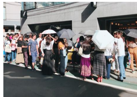
表参道店オープン時の行列