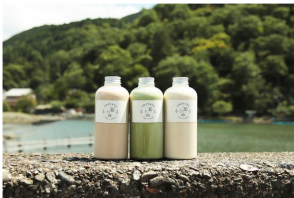
「ティーラテ」(ウバ/抹茶/ほうじ茶各580円)