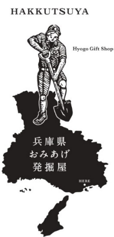
▲3階「兵庫県おみやげ発掘屋」店内イメージ（左）、ロゴ（右）。ロゴは日本グラフィックデザイナー協会会長・佐藤卓氏が「県外の方から見た兵庫県」を表現。