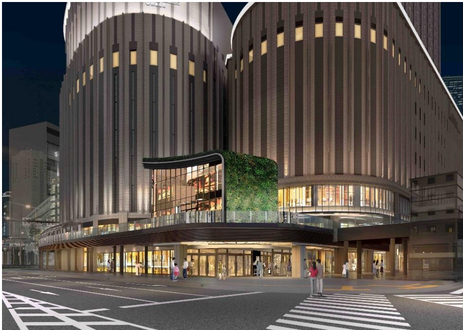
完成イメージパース(夜景 計画地北東側から)