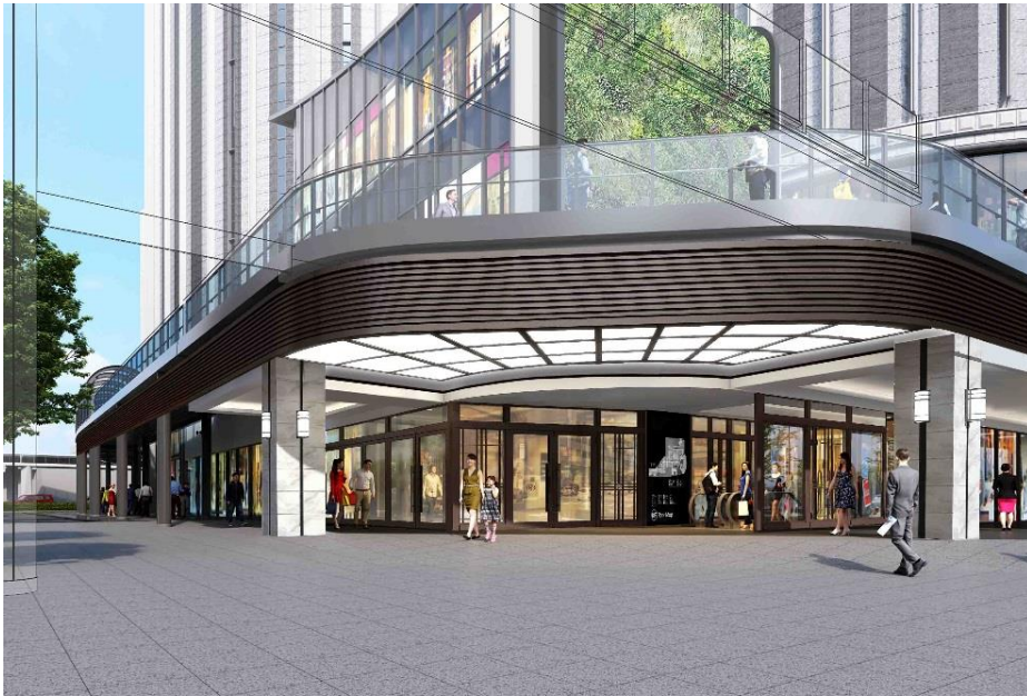
完成イメージパース(1階 北東エントランス)