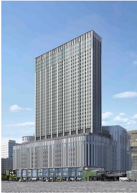
完成イメージパース (計画地北側から)