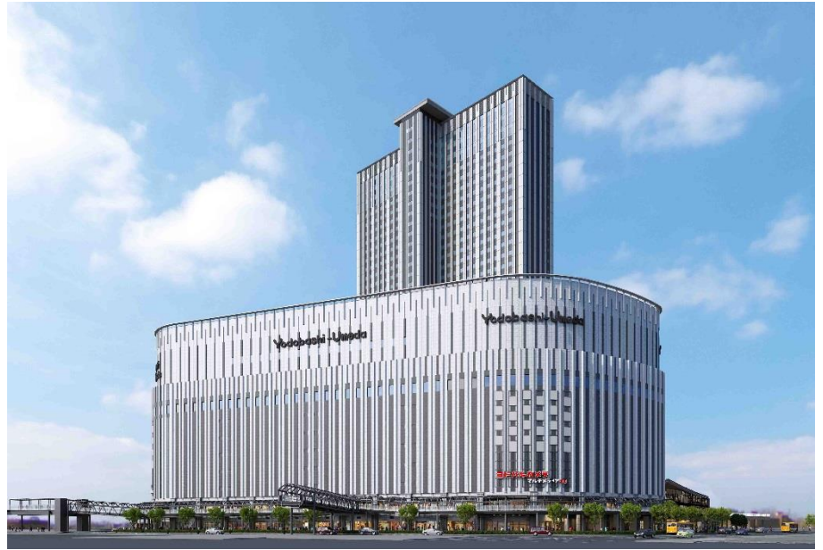
完成イメージパース (計画地南側から)