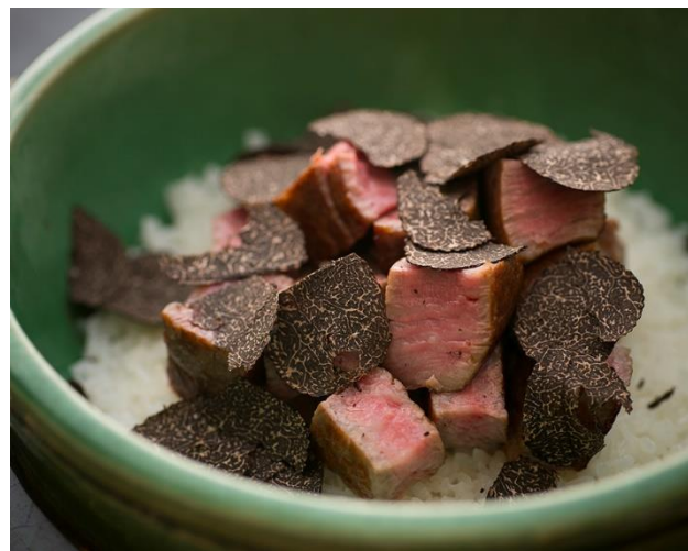
シャトーブリアンと黒トリュフのビビンバ