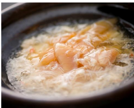
毛蟹のフカヒレステーキ