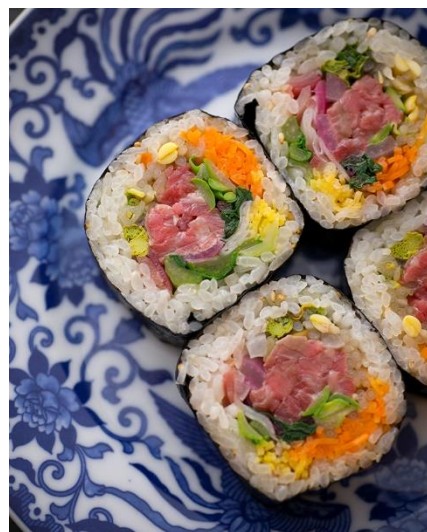
持ち帰り用のキンパ

コース料理以外に、今後テイクアウトメニューとしてお土産に最適な一口サイズの「キンパ」（税別3,000円 ※ 予定）もご用意する予定です。