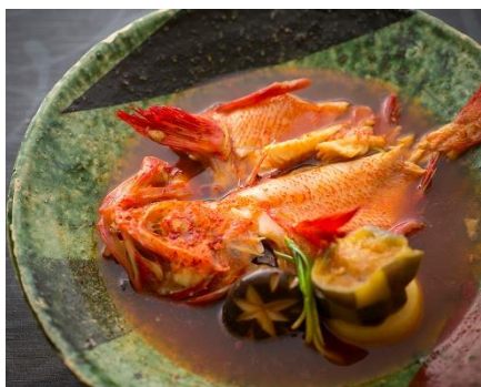
ヤンニョムで味付けた北海道産さんま